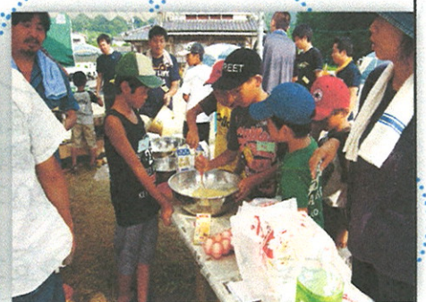
▲ 7月21日「そうめん流し」