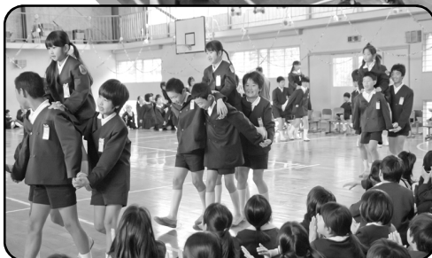
騎馬を組んで1年生大行進

今年も1年生を迎える会がありました。小学校はどんなところだろうとわくわくしている1年生、騎馬に乗せてもらった時は緊張していたけれど、楽しいゲームやプレゼントをもらって笑顔が一杯。これで笠岡小学校の仲間入り！