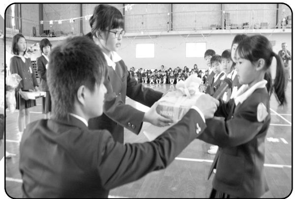
お兄さん・お姉さんからプレゼント