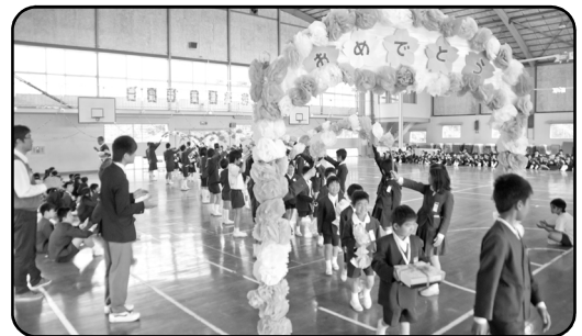
アーチをくぐって入退場