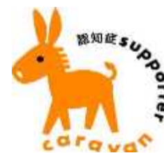
認知症サポーターキャラバン マスコットキャラクター 「ロバ隊長」

H17年4月「認知症を知り地域をつくる10ヵ年」キャンペーンが開始され、「認知症サポーターキャラバン事業」が始まりました。