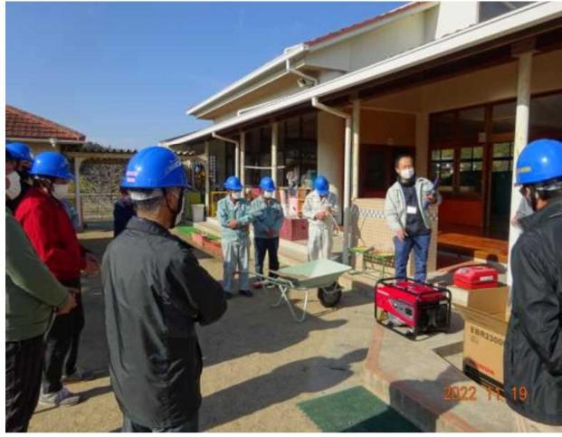
尾坂自主防災会 避難所開所訓練