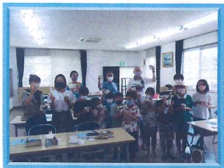
〈ポーセラーツ体験〉