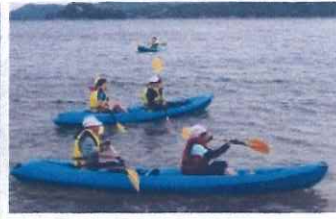
いきいき交流スクール

そうした様子をなかなか見ていただけないのは残念ですが、子どもたちや学校をこれまでと変わらず応援していただけるとありがたいです。