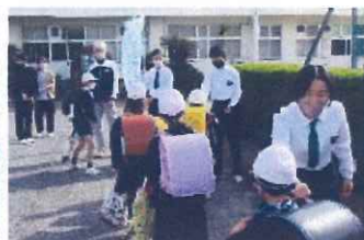
小中あいさつ運動