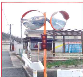
【腐食が進んだ注意標識】

前年度は、通学路に設置されているカーブミラーの総点検を実施しました。老朽化が進み清掃しても綺麗にならない箇所や見通しの不良箇所及びカーブミラーの下方に設置されている腐食が進んだ注意標識等を調査したところ、整備が必要な箇所が散見されました。