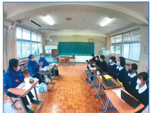
【まち協と金浦中生徒との活動調整打合せ】

残念ながら書面スペースの関係で、この全容を紹介することができませんが、まち協としても令和 4 年度中にこの計画の実践に向けて協力していきます。