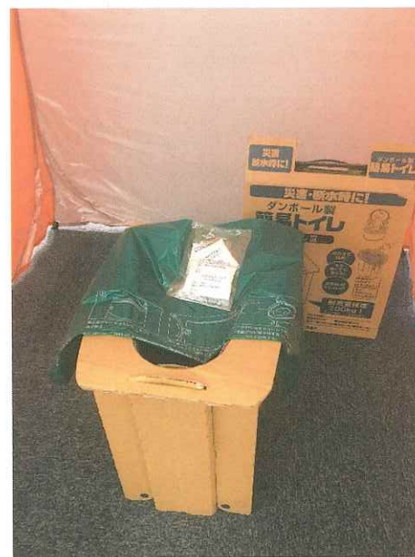
実際に現場で活動した資器材の展示やグッズなどを確認した。