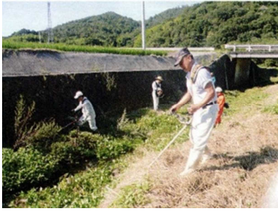
尾坂自治会 尾坂川草刈り