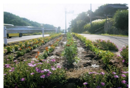
尾坂バス停前花壇