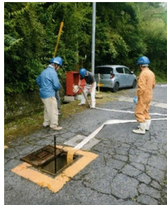
関戸団地 消火栓使い方講習会