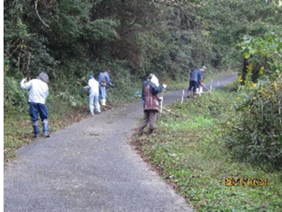
南西地区草刈り隊（4部） 大之平地区市道草刈り