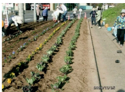
笠岡消防署北出張所前花壇