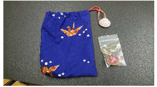
吉田婦人会 敬老会プレゼント作り