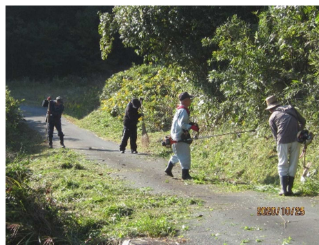
大之平 市道草刈り

地区内の各種団体の運営に必要な資料作成に吉田文化会館のプリンターを使用してもらい、その印刷代を支援します。