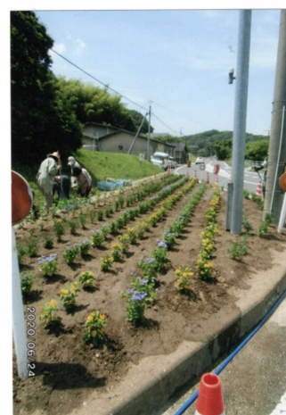
消防署北出張所前花壇