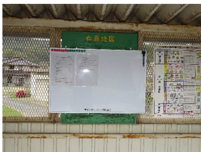
吉田仁吾地区掲示板