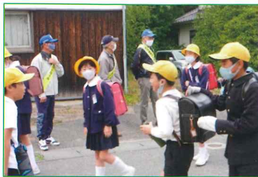
【金小児童の下校時見守り活動中】

また、青パトによる防犯活動についても金浦小学校の始終業時における一斉下校時に合わせて継続実施していますが、「通学路を中心とした安全の確保」を目的とした諸設備の改善については、ある程度進捗していることに加えてコロナの影響もあり、滞っているのが現状です。