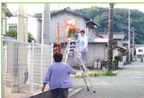
【金浦鉄南地区 清掃作業】