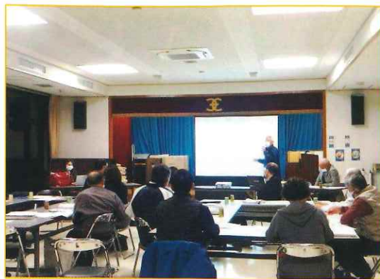
【香川大学磯打特命准教授をお招きし、打合せ中】

これら「計画書」は、令和3年度中に完成させるように部会員が団結して奮闘しています。