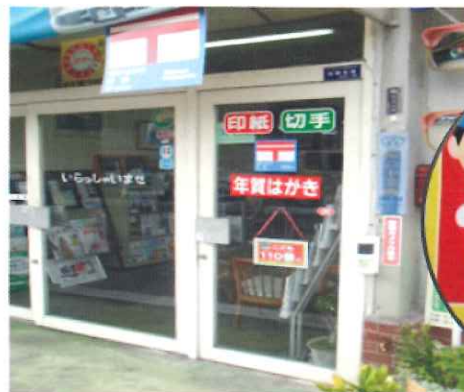
【子ども110番見直し設置】