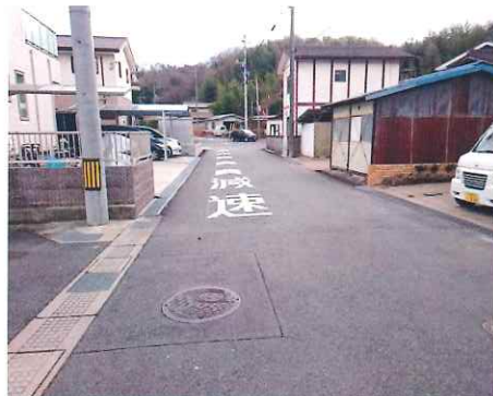
【通学路へ減速表示設置】