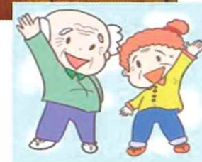
【ワイヤレスコール機器 貸出事業】