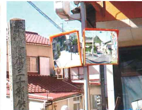
【通学路の老朽カーブミラー取替】