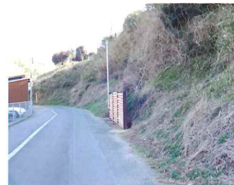
【通学路へ落石防止柵設置】