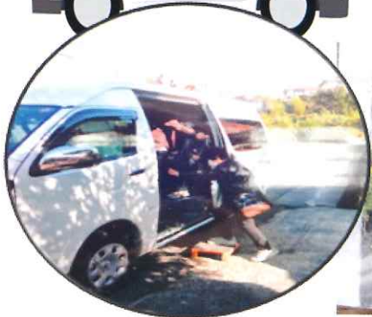
【買物支援事業 袖解さくら会メンバー】