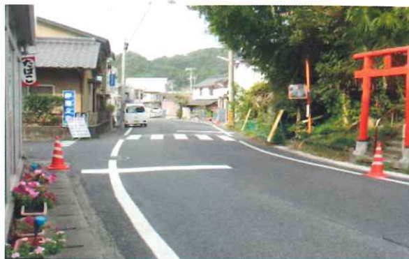
【通学路へ横断歩道の新設】