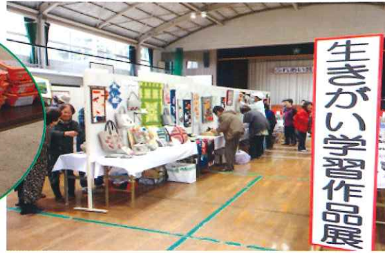
【公民館主要事業 敬老会・地区民体育祭・芸能文化祭】