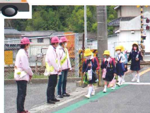
【下校時の児童見守り活動中】