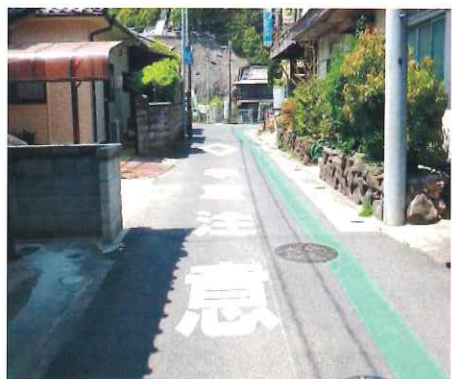
【通学路へグリーンベルトの柵設置】