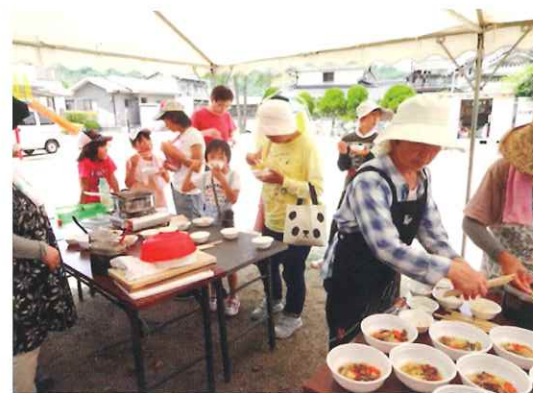
【防災研修及び訓練 生江浜地区】