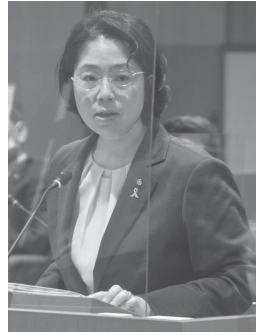
まなべ ようこ 真鍋陽子議員