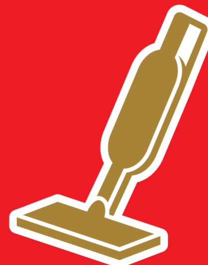
ハンディクリーナー