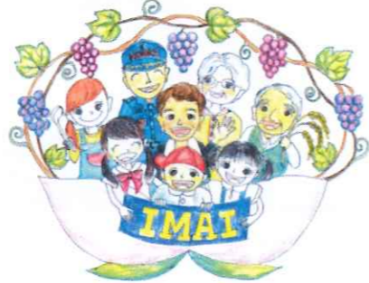
(今井地区まちづくり協議会イメージイラスト)