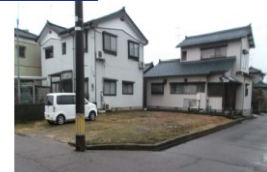
新潟県燕市(土地) 譲渡額約350万円