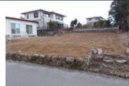
三重県津市(土地) 譲渡額約270万円