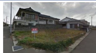
鹿児島県いちき串木野市(土地) 譲渡額約350万円