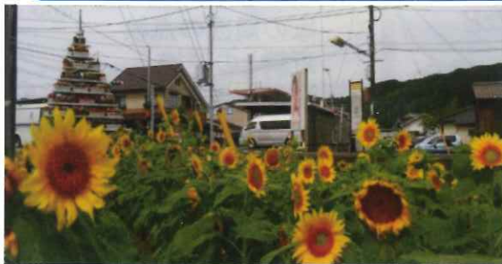
「晴れの国岡山農協」 笠岡北支店北側「花の塔」