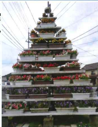
ひまわりと 花の塔 とてもきれい♡

山口大前堂の お地藏様で毎年 八月の地藏盆の日に お接待を行っていましたが、 今年は、コロナウィルスの 影響で中止になりました。 お地藏さまは、子ども達を 事故や災害・病気などに遭 わないように見守ってくだ さいます。いつでもお参り してください。