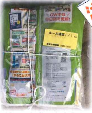
▲ビニルに入ったままの雑誌が縛ってあります

新山地区内各所にゴミステーションがあります。既に収集を終えているにも関わらず出されたゴミが収集されずに残っていることがあります。