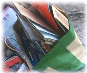
▲雑紙とダンボールが混ざっています