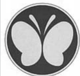
聴覚に障害のある人が運転する車に表示が義務づけられるマーク