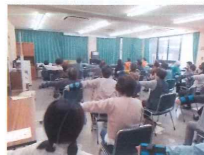
【2/18(月) いきいき100歳体操】 新たな取り組みとして、笠岡市地域包括支援センターの指導のもと行われました。幸せな気分で生きるためには、健康に気を配ることも大切ですね。(55名参加)