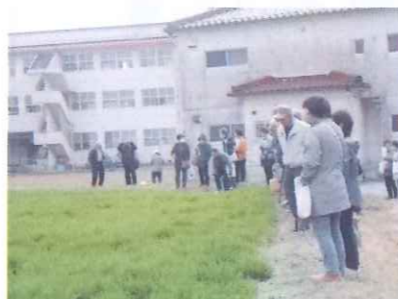
【3/26(日) 宇治町もち麦視察】 地元地区民の団結力と若者の結束力を見て故郷を思う気持ちが、人一倍強く感じられました。(44名参加)