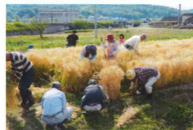
【6/1(土) キラリモチ(もち麦)刈り】 寒い中麦踏みをしたたり、強風で倒れた麦を皆で起こしたり、苦労もありましたが、麦刈りの日を迎えることができました。ボクもいっぱいガンバッタよ(^_^)v (35名参加)