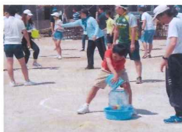
【5/25(土) 今井公民館運動会】 まちづくり協議会として防災バケツリレーを企画しました。大人も子供も一生懸命がんばっていましたが、・・・