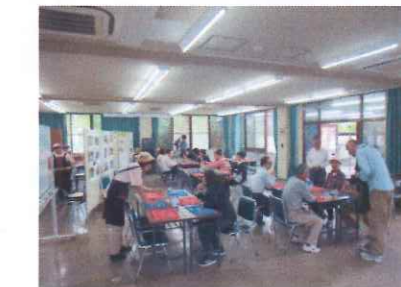
【5/18(土) オープンカフェ 今井うまいや初開催】 地元の野菜を使ったサラダ、休耕地対策で育てたそばを使ったうどんなど、今井婦人グループのボランティアが中心となって運営しております。毎月第二土曜日の午前10時から、家庭的な雰囲気の中で、ご近所同士、お友達同士で楽しいひとときをお過ごし下さい♪(来客数77名、運営17名)