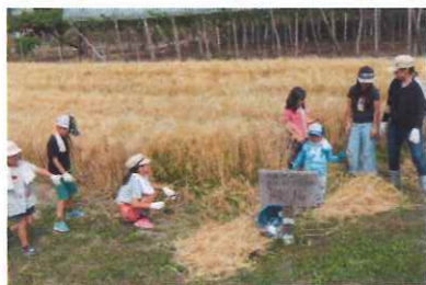
今井地区の未来を背負う子供たちが一生懸命がんばってキラリモチ刈りを手伝ってくれました♪