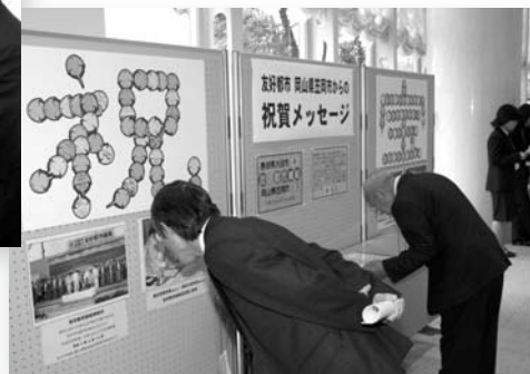
世界遺産登録記念式典会場ロビーの風景