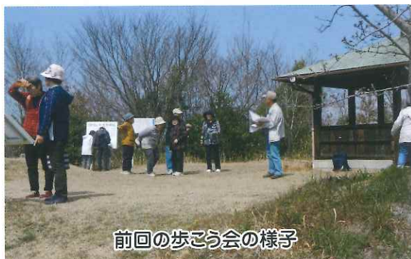
前回の歩こう会の様子