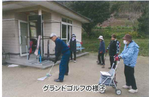
グランドゴルフの様子