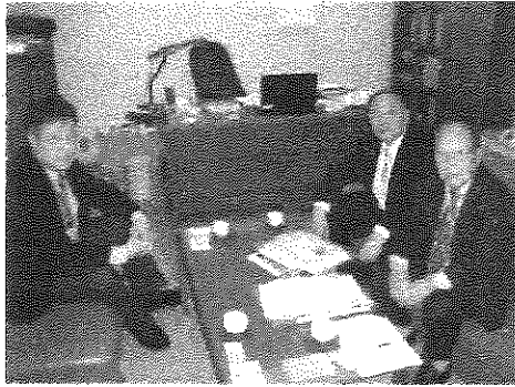
和歌山県 那智勝浦町立図書館関係