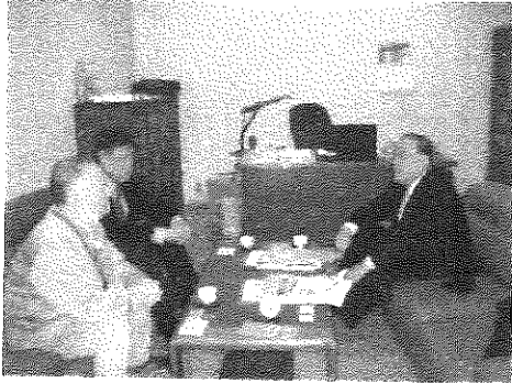
和歌山県 田辺市立美術館関係