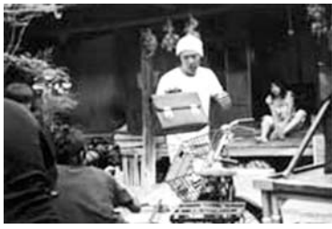
真鍋島でのロケ風景

笠岡諸島フィルムコミッションの協力の下、風光明媚な真鍋島を舞台に撮影された映画「旅の贈りもの」の上映会を開きます。