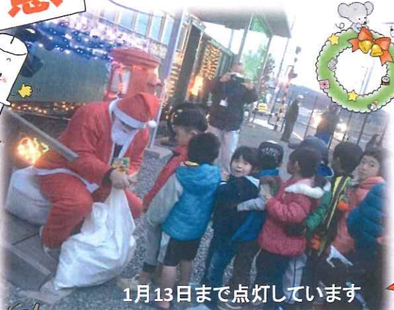
1月13日まで点灯しています