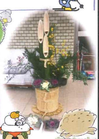
▲昨年12月9日クリスマスイルミネーション点灯式の様子 ▲自治会の玄関へ。地元の方の手作りです。