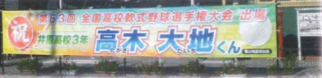
▲井笠鉄道記念館フェンスに横断幕を掲げていました。