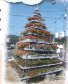
▲花の塔がきれいです