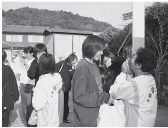
▲別れを惜しむ選手らと協力会の人々。連絡先を交換し、継続的な交流を約束する姿もあった。

10月21日に、石川県チームが吉田文化会館に到着しました。最初はお互いに緊張していましたが、すぐにうち解け、談笑する姿が見られました。また、試合会場では協力が一杯の応援を繰り広げ、試合後は、手と協力会の皆さんがお互いの健闘