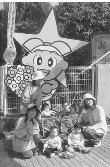
▶吉田保育所の児童たちが、ももっちの前で記念撮影。この歓迎ももっちは地域の要望を受けて引き続き設置されており、来訪者を温かく出迎えている。