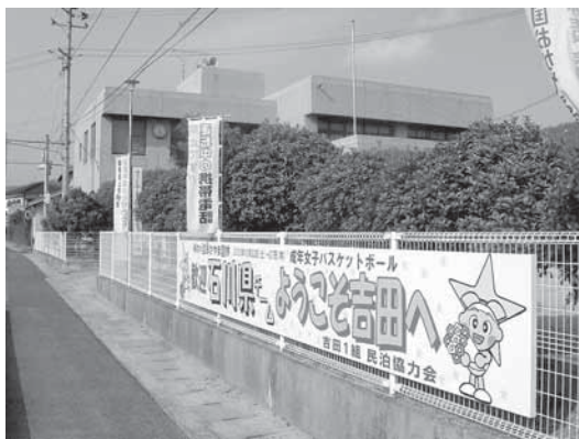
▲吉田文化会館前に設置された歓迎看板。幅は7.2メートルにもおよび。

10月19日(水)から27日(木)までの9日間は、国体民泊拠点として使用するため、市民サービスクーナーを除くすべての施設は、国体関係者以外の利用はできません。ご迷惑をおかけしますが、よろしくお願いたします。