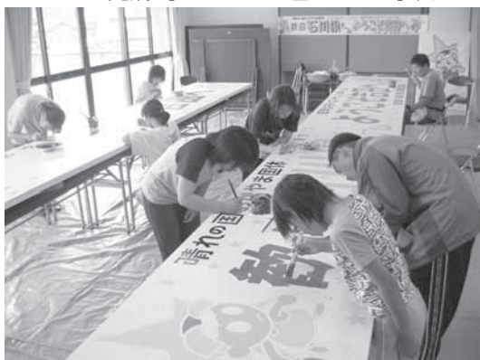
▼民泊協会の役員と子ども会が協力し、約2週間がかりで完成。子どもたちも色ぬりをお手伝い。