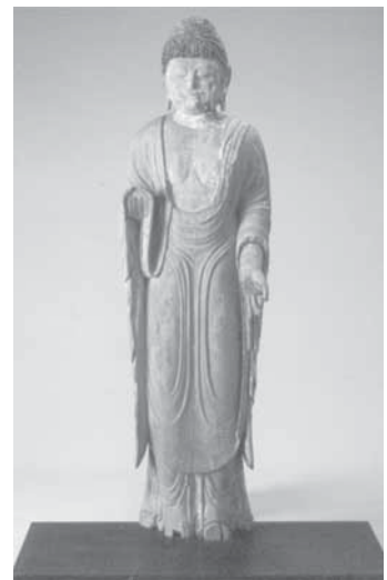
県指定重要文化財 如来立像 (三宝院)

坊の中心である本堂の本尊であったといわれています。一本の木から彫り出す一木造という製法で作られており、古い様式を残しています。また着物を朱色に塗るなど全身に彩色を施しています。 穏やかなお顔や衣紋の表現など、全体的に温和な造作で、十一世紀中頃の製作と推定されています。平安時代の仏像は県内でも数が少なく、貴重なものです。