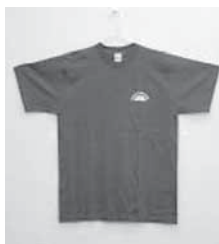
前面 (バックプリントなし)

Tシャツ (色：青) 一枚 1000円 (税込) サイズ：100～150cm SS～XO