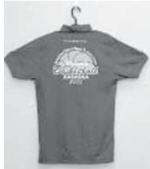
背面 (前面にTシャツ同様のポイントあり)

Tシャツ (色：青) 一枚 1000円 (税込) サイズ：100～150cm SS～XO