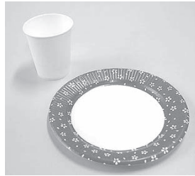
紙コップ・紙皿など