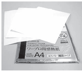
感熱紙 (ファックス、ワープロ用紙など)