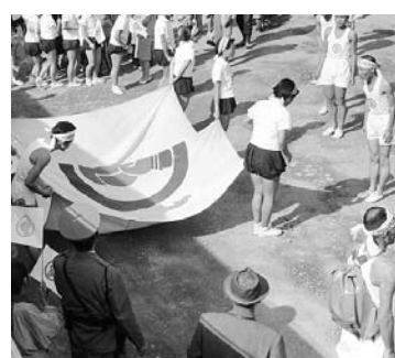
▲市内での国体旗リレーの様子