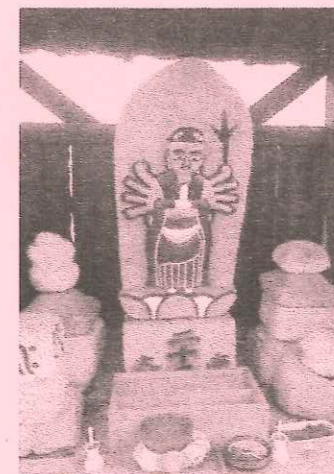
助実 二十五番観音霊場 筑波山 大御堂

活動に興味を持たれる方は事務局の藤井琢三さん(080-6304-5279)まで申し込みください。