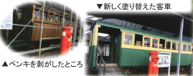
▲ペンキを剥がしたところ