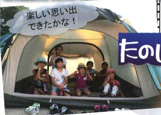
楽しい思い出 できたかな！