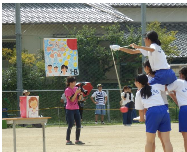
学年種目〈2年〉荒野の83人

また演技の中で、騎馬に乗って球を振り回し、前方の缶がぼこぼこになるシーンは、担任の先生には気の毒でしたが楽しく観覧させて頂きました。(※生徒が担任の先生の顔を描いています。)