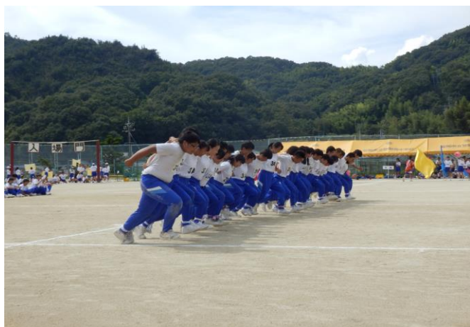
学年種目〈3年〉プラス1脚走