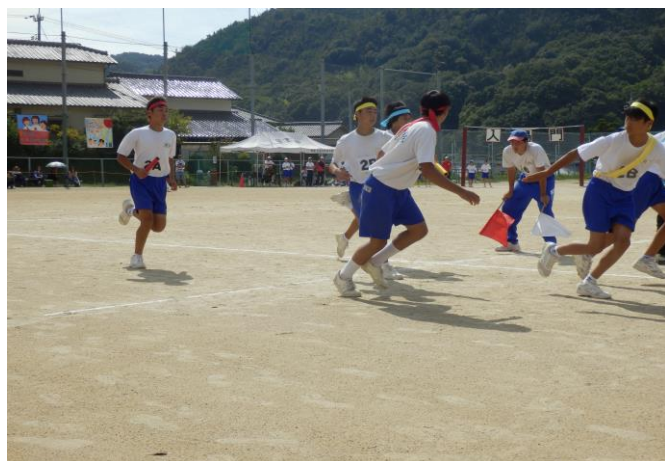
1. 2. 3年男子 800mリレー